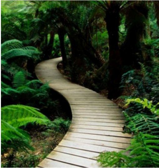
Propuesta de piso entarimado para recorrido de salida atravesando el jardín