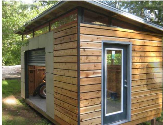
Idea para estructura de nueva cafetería y baños