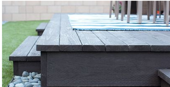
Deck para área de cafetería nueva