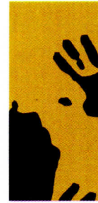
Museo Memorial de la Resistencia Dominicana